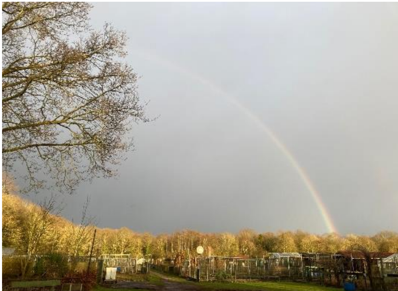
Foto gemaakt door Corry Duindam, Januari 2022: Een zegen over het nieuwe tuinjaar