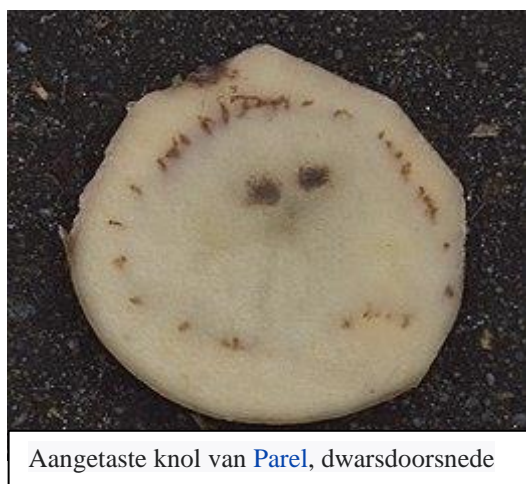
Aangetaste knol van Parel, dwarsdoorsnede

Op de tuin komt de ziekte Fytoftora op dit moment veel voor. De ziekte tast de aardappelplant zowel bovengronds (bladeren en stengels) als ondergronds (de knollen) aan. Op het blad verschijnen 1 à 2 cm grote olieachtig verkleurde vlekken. Binnen een dag worden de bladvlekken bruin met een lichtgroene rand. Aan de randen van de vlekken groeit de schimmel verder en tast zo heel het blad aan. Uiteindelijk sterft het blad af. Op de knollen is de aantasting zichtbaar als roestbruine tot blauwachtige door de schil schemerende vlekken.