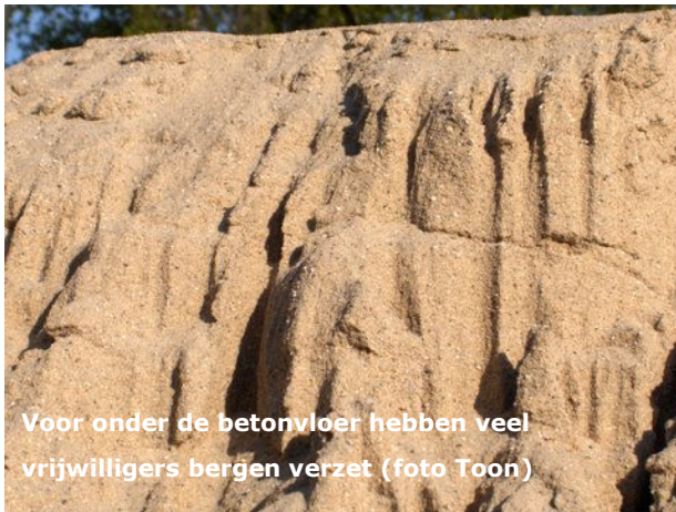
Voor onder de betonvloer hebben veel vrijwilligers bergen verzet

2009 is financieel gezien een goed jaar geweest. Mede door de geslaagde pompoenendag sloten we het jaar af met een positief saldo van ruim 9000 euro. Dit is iets hoger dan was voorzien in het financieel beleidsplan 2009-2014, zoals dat op de extra ledenvergadering van 12 september 2009 door de leden is vastgesteld. Door het mooie resultaat is het mogelijk 30.000 euro opzij te zetten voor de renovatie van het verenigingsgebouw.